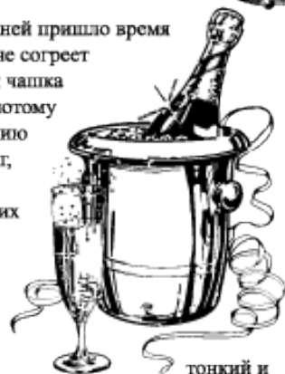
тонкий и называют

Дарджилинг - это нежный дневной чай, более светлый в настое, чем ассаиские и цейлонские чаи, обладающий тонким вкусом и богатым, изысканным ароматом. Пьют его без молока и сахара.